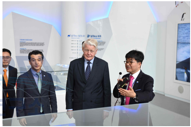
· 극지홍보관에서 우리나라 쇄빙연구선 아라온호의 설명을 듣는 그림손 대통령