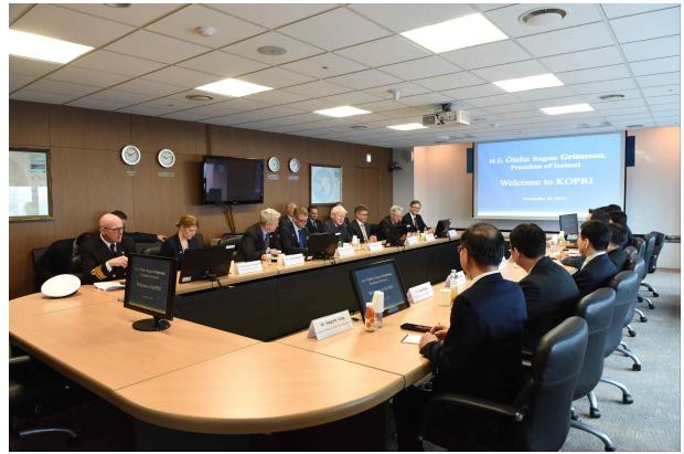
· 우리나라 북극 연구활동 현황 소개