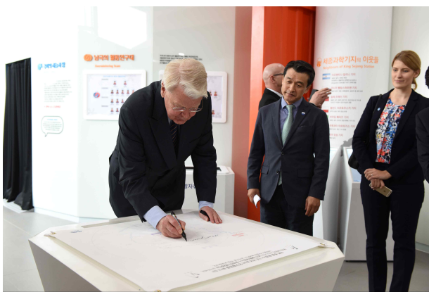
· 남극과학기지 월동연구대에 응원의 메시지를 작성 중인 그림손 대통령