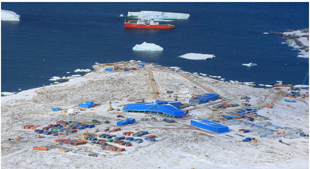
《 남극장보고과학기지 전경 》