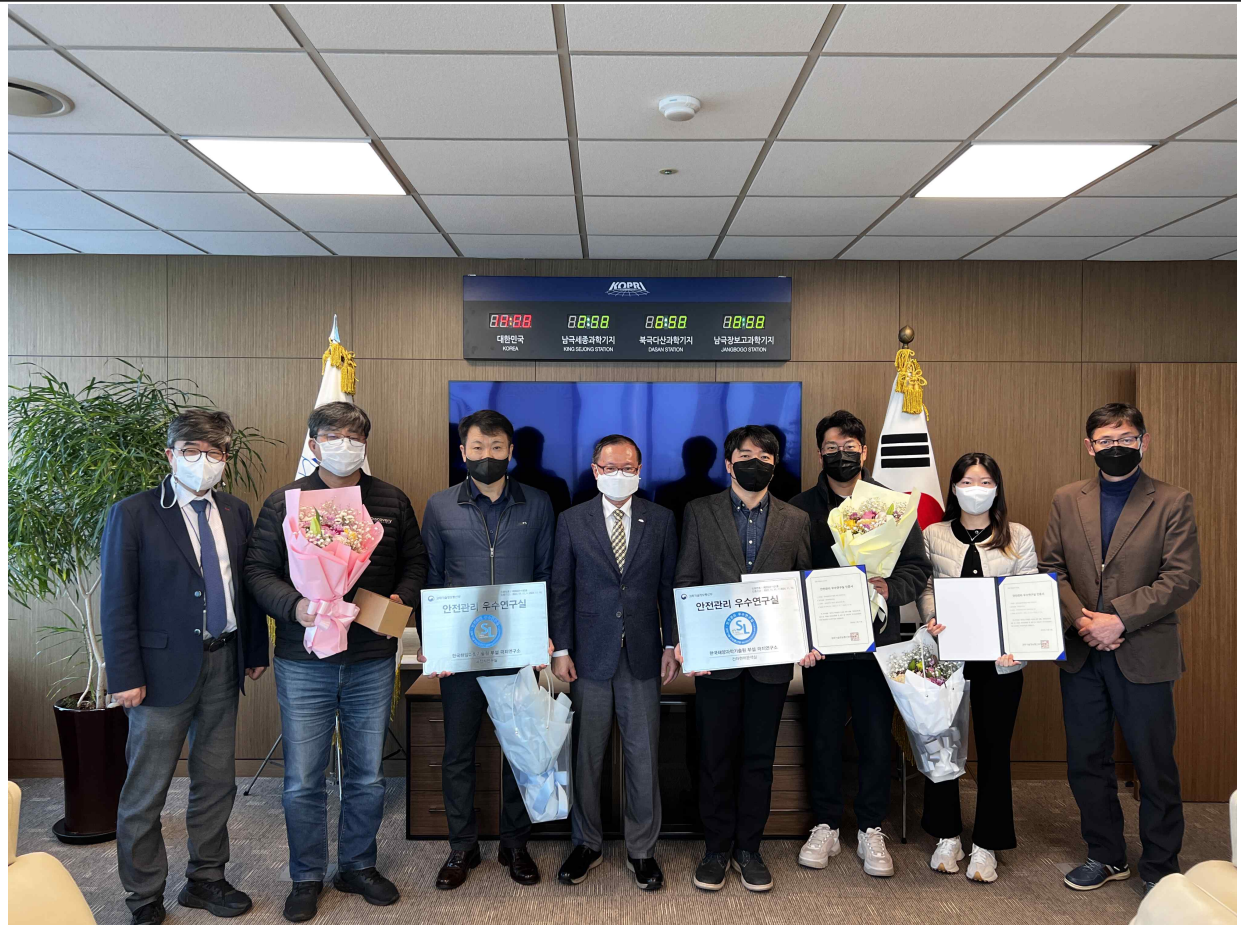
인증서/인증패 전달식 사진