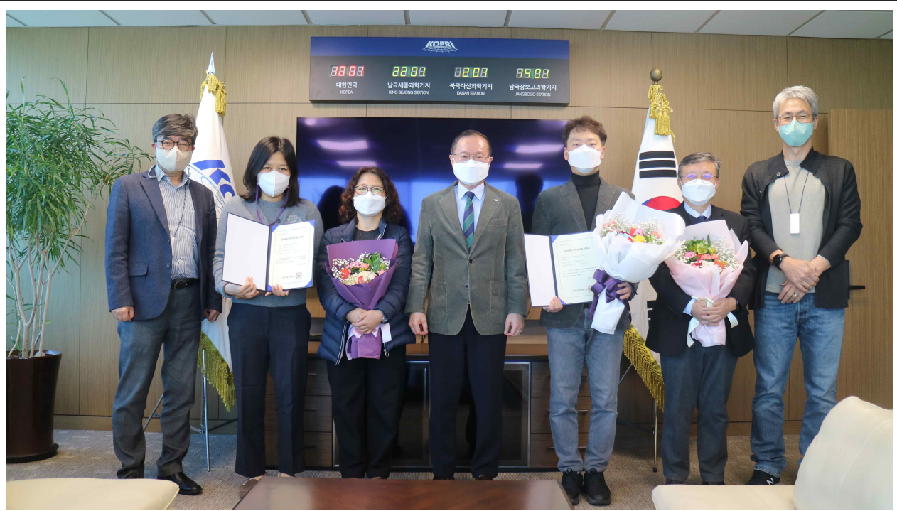
인증서/인증패 전달식 사진