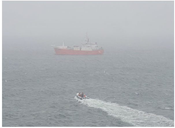
고무보트, 어선으로 이동