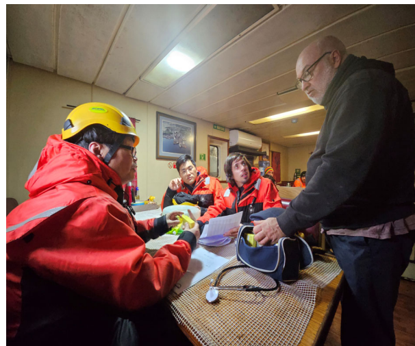
아라온 의약품 전달