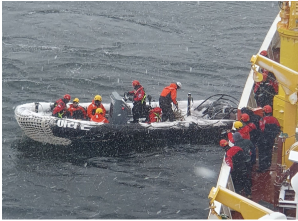
고무보트 탑승(선의, 스페인어 통역, 1항사)