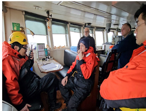
Zoom, 무전기 활용 원격 진료 자문